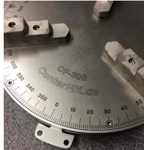
Bild unten rechts: Skala (vertieft eingefräst) mit Zeiger auf Bedienhebel

Bild rechts + unten links: 360-Grad Skala auf Systemdeckel (Laserbeschriftung)